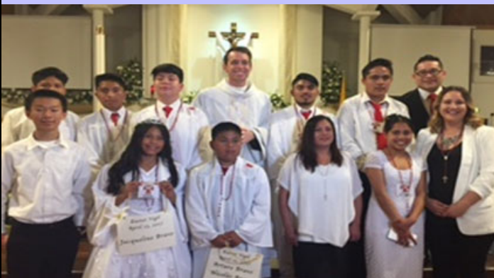
Felicidades a los Neófitos (recientemente bautizados) y Candidatos que recibieron los sacramentos de iniciación en la Vigilia Pascual este Sábado pasado.